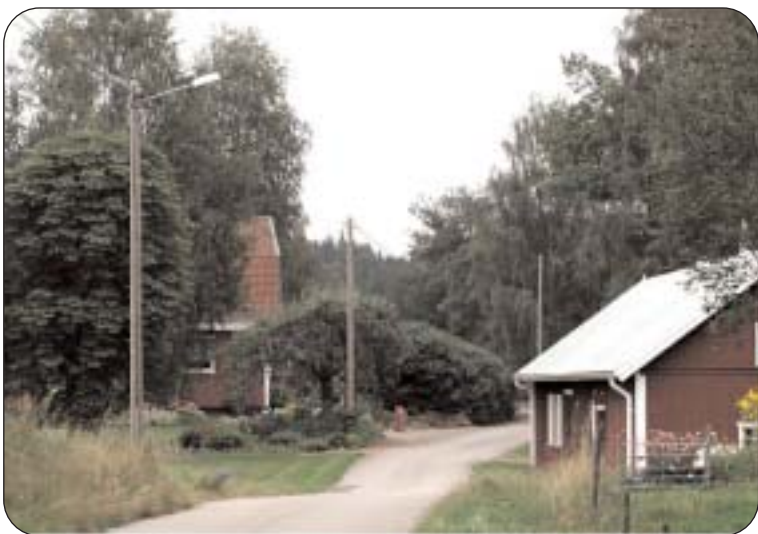
Indragningen av belysningen på landsbygden är ett fattigdomsbevis för Alvesta kommun. Även befolkningen på landsbygden behöver belysning för sin säkerhet. Vi vet alla att det många gånger är ganska mörkt när skoleleverna både åker och kommer hem. Deras välbefinnande är lika viktigt oavsett var de bor i kommunen. Vi vill ompröva beslutet om indragningarna på belysningen.