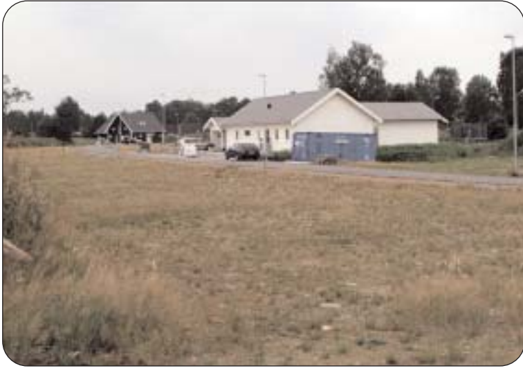
Medan 330 står i tomtkön i Växjö har bara två villor blivit uppförda på Högsången i Alvesta. För att locka till oss nya invånare måste vi skapa förutsättningarna för detta. Skattesänkning är ett huvudkrav och anpassning av tomtpriserna ett andra krav.