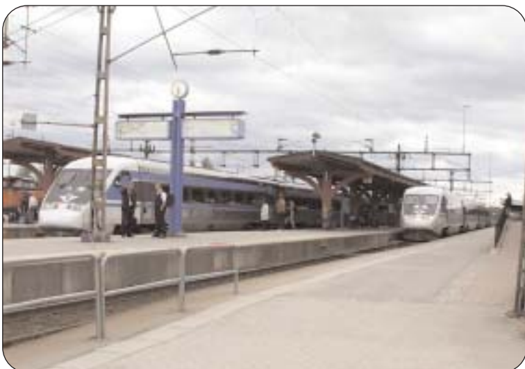
Vi vill i motsats till övriga partier satsa på en utflyttad bangård och göra en renodlad persontågsstation i Alvesta. En dylik station skulle möjliggöra fler tåglägen för nya tågpendlar och dessutom friställa stora ytor för parkering eller byggnation av kontorsbyggnader i nära anslutning till resecentrum.