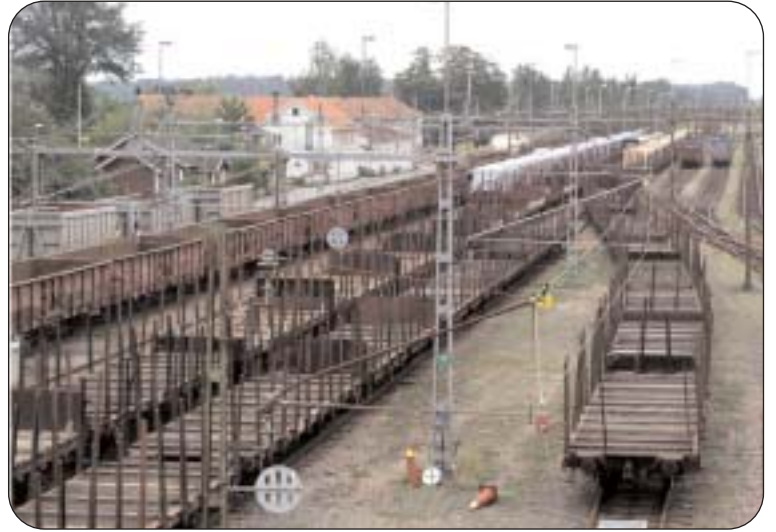
Som synes kan det vara trångt på bangården i Alvesta. När Alvesta - Karlskrona blir klar efter upprustningen och Verkö inom en inte alltför avlägsen framtid får tågfärjetrafik blir situationen än värre. Av det skälet är utlokalisering av godsbangården nödvändig om inte Alvesta skall bli en arkilleshäl i den fortsatta utvecklingen av järnvägstrafiken.