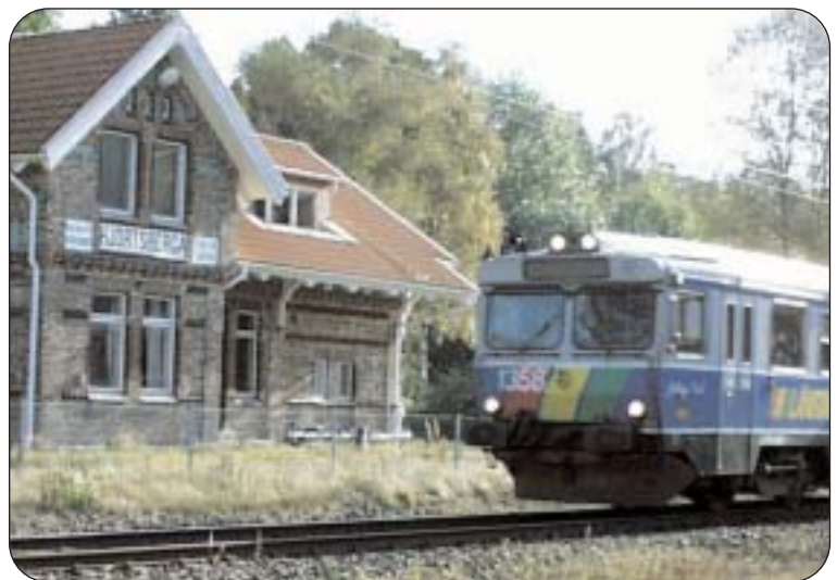
Vi vill arbeta för fler tågstopp i kommunen. Förutom de redan beslutade i Vislanda och Moheda också i Hjortsberga och ett nytt stopp vid Lilla vägen i Alvesta. Behövs det för att inte störa annan trafik vill vi att stationerna förses med sidospår så annan trafik kan passera under uppehåll.