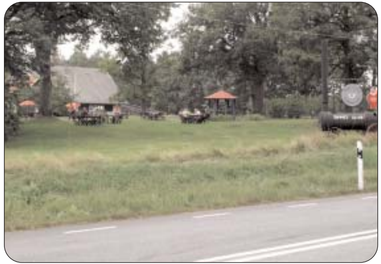
Trafikverkets nya rastplats bör lokaliseras till området i närheten av Hjärtenholm. Dels för att man då kan betjäna både väg 25/27 och väg 126 och dels för att det idylliska området i och kring Lanbruksmuseumet blev en naturlig del i rastplatsen.