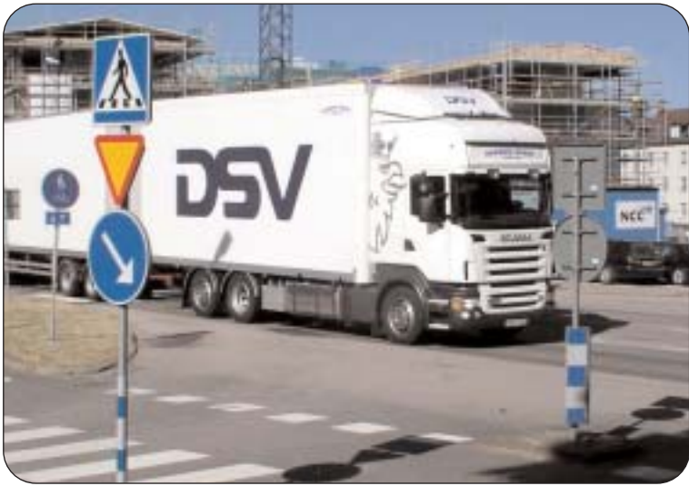
För att åstadkomma en bättre miljö och trafiksituation i Alvesta centrum vill vi aktivt arbeta för att väg 126 i likhet med Moheda och Vislanda får en dragning utanför samhället. Ingen är betjänt av att nya "lösningar" tas i bruk som bara flyttar problemen till ett annat bostadsområde.