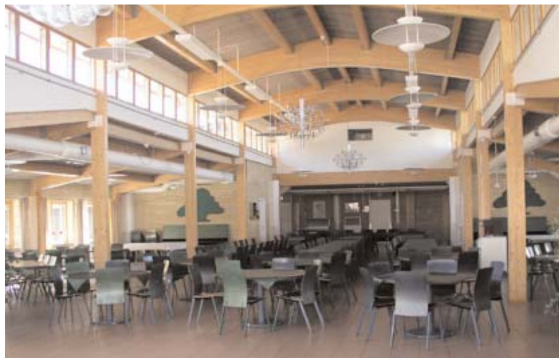
Lika outnyttjad är Stenlyckeskolans matsal som dess tillagningskök. 240 gäster får plats i en förnämlig matsal. De kvarvarande gymnasieeleverna får nu i stället vandra till Fordonsgymnasiet på Maden för sina luncher.