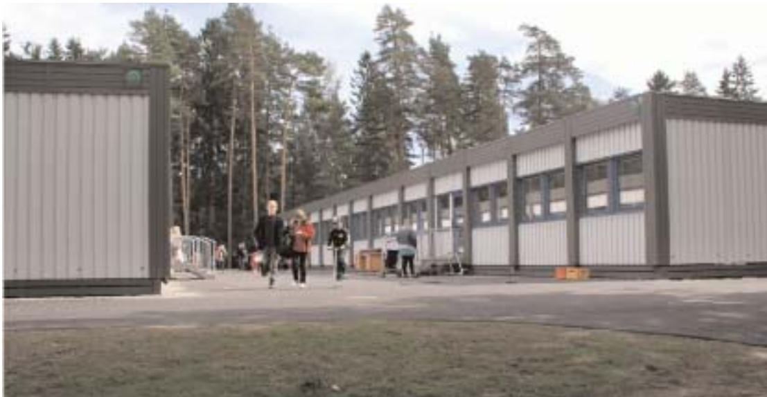
De nya trevliga paviljongerna är placerade på den gamla fotbollsplanen vilket innebär att de blockerar för den idealiska placeringen av en ny sporthall. Något som planerarna tydligen missbedömt.

Ytterligare en miljonsatsning på skolor drogs igång hastigt och lustigt i maj när det stod klart att beslutet om stängning av Vegbyskolan var fastställt. Under några hektiska sommarmånader placerades två paviljonger vid Mohedaskolan och när personalen kom tillbaka var det dags för inflyttning.