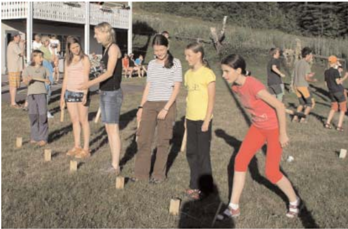
Kubb blev snabbt populärt bland de gästande orienteringsungdomarna. Spelet har blivit en tradition som alltid står på programmet avslutningskvällen.

När vi träffade honom i Hanaslöv i juli månad hade han en mycket ungdomlig grupp med sig. Han kunde glädja sig åt ett fantastiskt väder och många bad för ungdomarna runt om i olika sjöar. En upplevelse bara det för ungdomar som i hemlandet har väldigt få sjöar. Förutom orienteringsträning runt om i kommunen hann gruppen med ett gästspel i Gamleby och tävlingen Tjurst-2dagars innan det åter bar hem till Turnov.