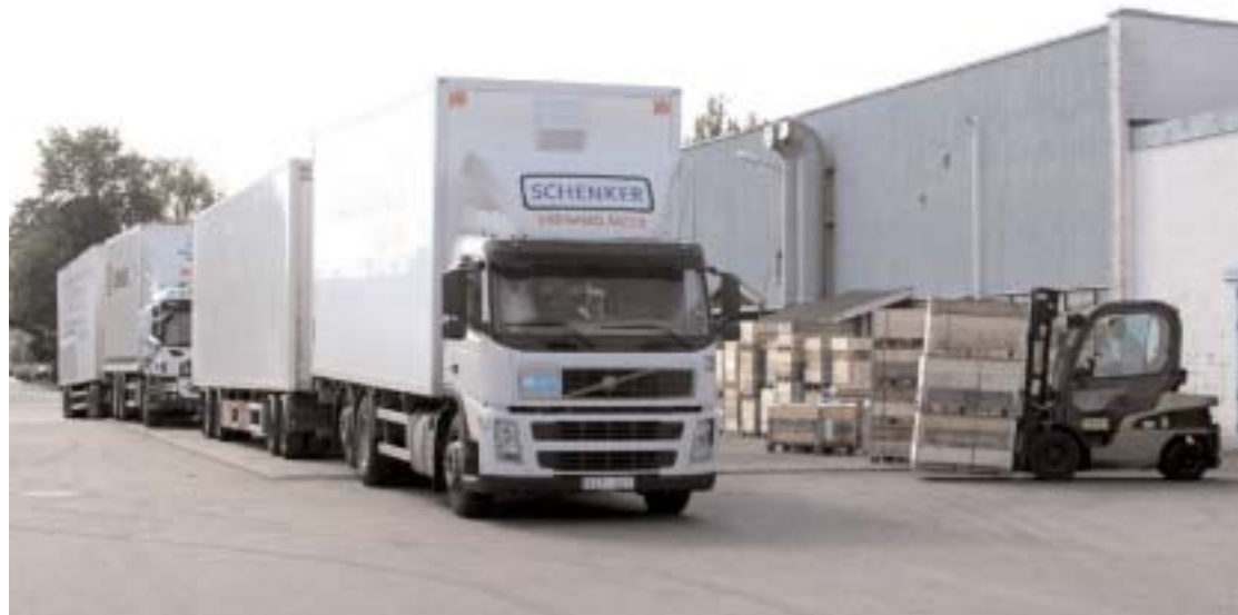
Snabbaste vägen till Sporthallen på Vegby går via Finnvedens lastområde. Tunga fordon och truckar innebär knappast att man kan kalla skolvägen säker.

Det är hög tid att Barn & ungdomsnämnden sätter sig ned och drar upp riktlinjerna för en skolpolitik som står sig åtminstone 10 år framåt i tiden. Kommunen har inte längre råd med investeringar utan framförhållning.