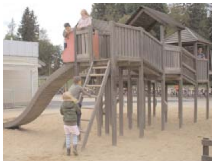
Faran är inte över för att ett antal lekplatser i kommunen försvinner om den nuvarande majoriteten får bestämma också kommande mandatperiod.

Med färre lekplatser betyder det att småtingar får längre och osäkrare vägar till sin lekplats.