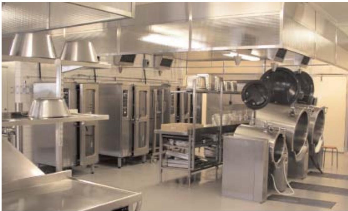
Kommunens största tillagningskök står sedan höstterminen avställt. Med en kapacitet på över 3000 portioner dagligen är detta en kapitalförstörelse av ofantliga mått tack vare mindre goda politiska beslut.