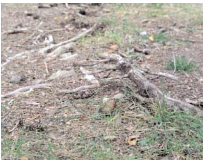
Användarvänligt är det inte precis i Hjortsberga el-ljusspår efter att Alvesta Energi sett till att belysningen åter kom på plats.

Vem som blir ansvarig vid en olycka i ett offentligt motionsspår på grund av bristande underhåll är förmodligen kommunen. Även om Hjortsberga Samhällsförening har ett skötselavtal så omfattar det säkert inte återställandet efter grävningarna. Som det nu är behövs omedelbara åtgärder för att få spåret funktionsdugligt. Efter att el-ljusspåret vid Spånen blev utan belysning efter Gudrun så nyttjas Hjortsbergaspåret av många Alvestabor. Det bör vara av kommunalt intresse att spåret hålls öppet inte minst för hälsans skull. Att lämna det i det skick som gjordes efter investeringen i belysningen är lite bortkastat.