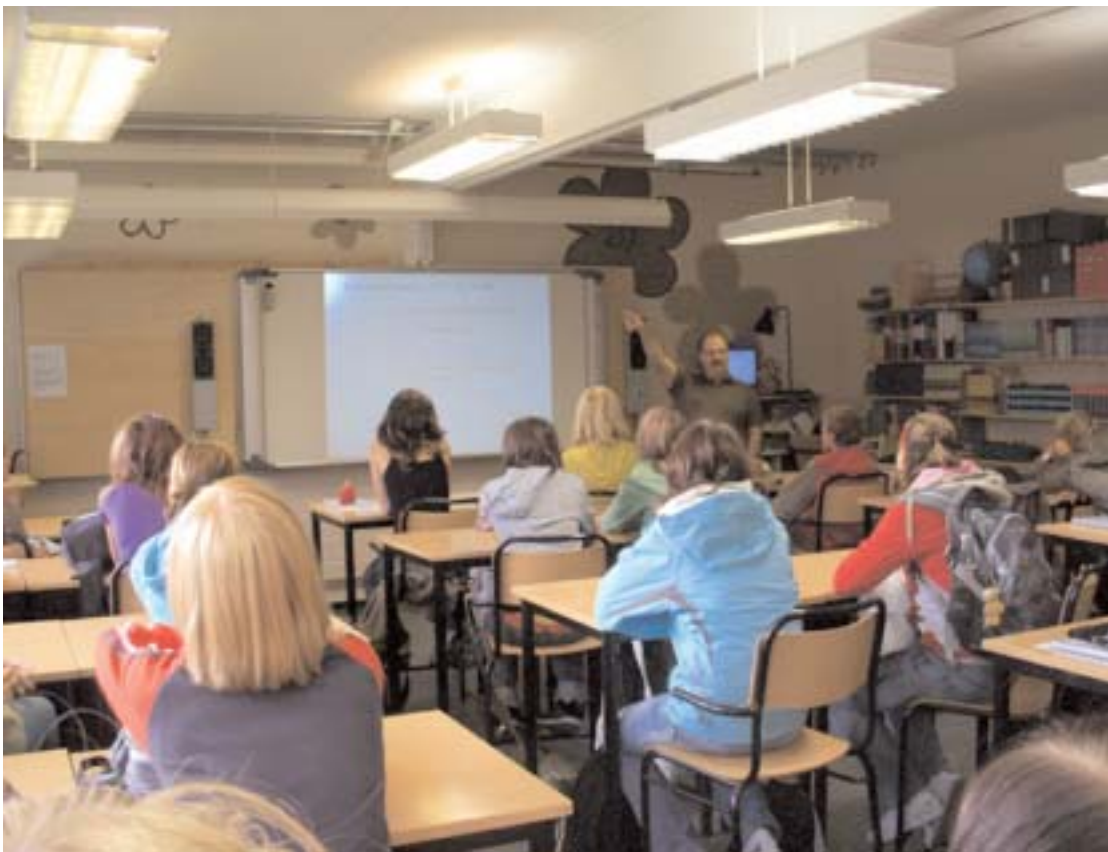
Flytten av klasserna 7-9 från Grönkullaskolan till gymnasieskolans gamla lokaler blir ett lyft för alla elever.

Det pågår en något underlig strid i media om våra skolor. Sedan stora delar av gymnasieskolan avvecklats och Grönkullaskolan vuxit lavinartat så måste utbildningsnämnden handla.