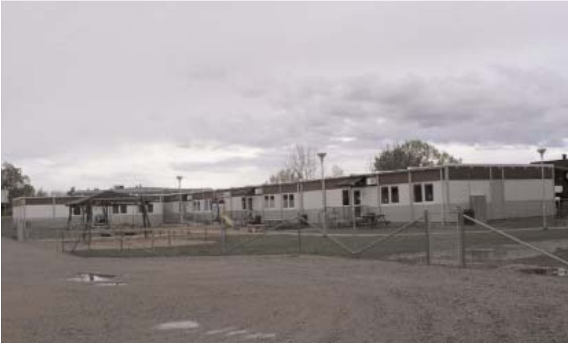
Paviljongerna för dagisverksamheten på Högåsängen kostar kommunens skolförvaltning 5,1 miljoner under de knappa två år de kommer att användas. Dessa kostnader läggs in i budgeten för Aringsgårdens ombyggnad och blir en del av framtida hyra.

Paviljonger, paviljonger och åter paviljonger tycks ha blivit den gyllende lösningen på Alvesta kommuns alla lokalproblem. Tillfälliga lösningar som har blivit dyra affärer för de förvaltningar som använ-