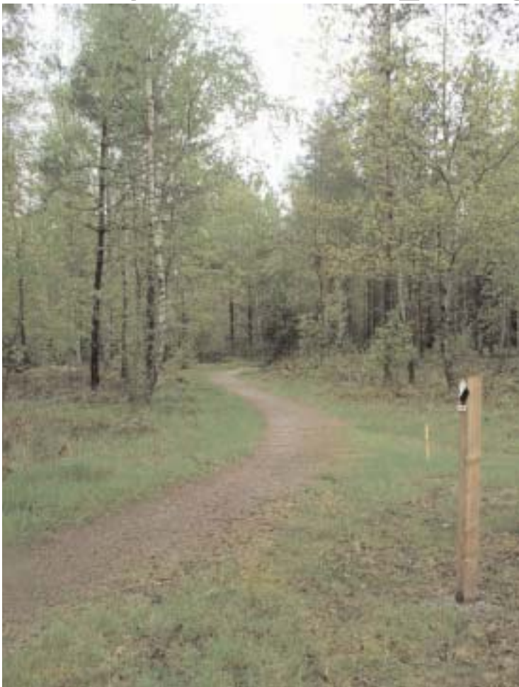
Trots allt ser det ut som att kommuninvånarna skall få sin inbjudande Spånenslinga el-belyst igen. Den har varit nedsläckt sedan stormen Gudrun 2005.

Tisdagen den 13 maj blev det så äntligen klart att motionsspåret vid Spånen åter blir belyst. Det har nu varit släckt sedan stormen Gudrun rev ned både stolpar och elledningar fredagen den 7 januari 2005. Men faktum var att politiken redan före stormen hade beslutat att släcka ned ljuset av besparingsskäl.