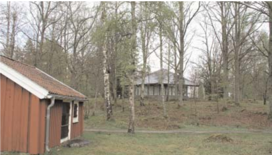
Hagaparken har fått en rejäl ansiktslyftning under vintern. Genom röjningsarbetet har parken blivit ljusare och en mycket inbjudande oas i centrala Alvesta.

Under vintern och våren har arbetet med att ge kommunens strövområde en rejäl ansiktslyftning fortgått. Hagaparken, Spånens badplats och strandpromenaden längs Spånen mot Hanaslövsområdet har idoga händer rensat på sly.