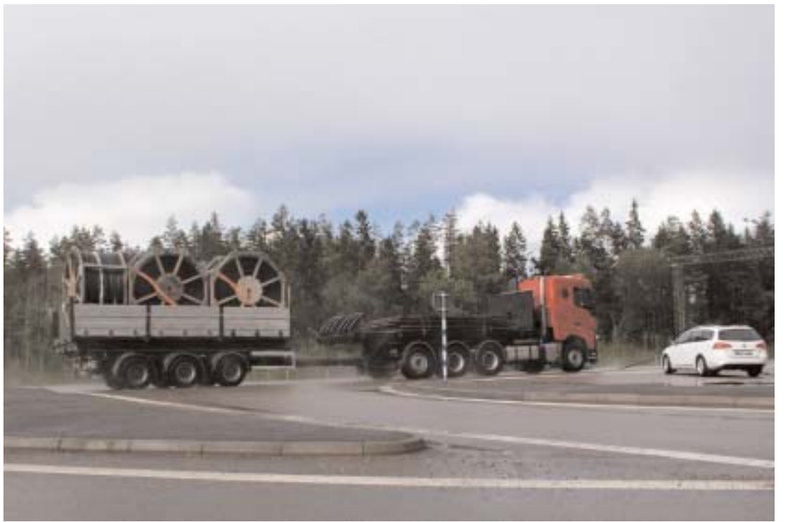
Västra infarten till Alvesta vid väg 25/27 har sedan ombyggnaden till 1+2 väg blivit en livsfarlig trafikmiljö för den oskyddade trafikanten. En trafikfälla som Trafikverket bortsett ifrån i snart fyra år. Det är nog få om inga trafikmiljöer, som denna, där vägverket höjt hastigheten till 100 km.

Det måste vara välkänt för Trafikverket att just denna sträcka har haft flera allvarliga olyckor. Trots detta har man inte vidtagit en enda åtgärd för att förbättra situationen för den oskyddade trafikanten. Nu måste det till handling. Innan sommarsäsongen tar sin början måste dessa enkla åtgärder vara genomförda. För ingen vill se att