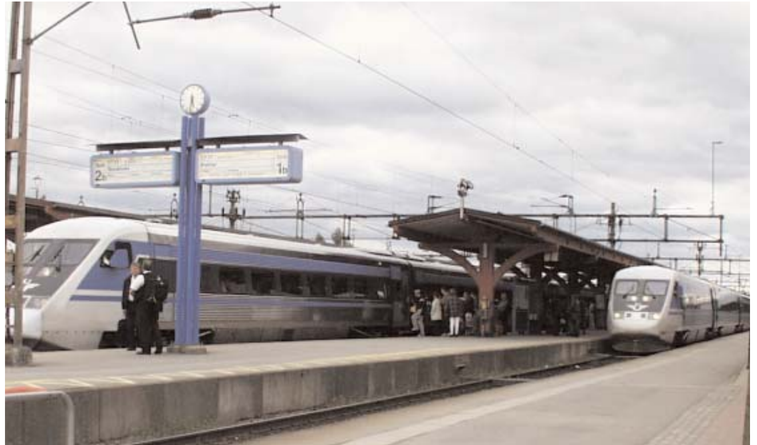
Alvesta Bangård är alldeles för liten för att klara den expansion som förväntas på järnvägstransporterna. En utflyttning av godsbangården blir ett måste om målen skall uppfyllas.

Också färdigställandet av Fornvägen tvingar fram en utredning över en ringväg på östra Alvesta. Dels för att minska genomfartstrafiken genom bostadsområden och dels för att öppna upp möjligheten för östra Alvesta att nå Alvesta centrum utan att behöva passera plankorsningen vid Länsmansbac-