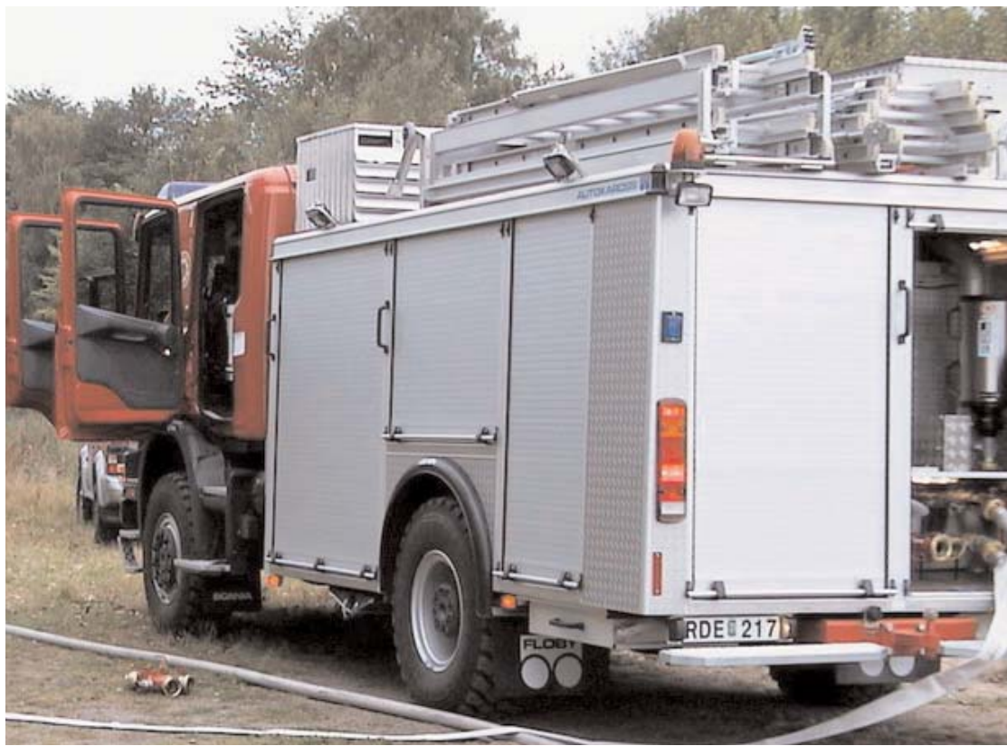
Det blev bygden som gick segrande ur striden om deltidbrandkåren i Moheda och Ingelstad. Som det nu ser ut blir det fortsättning på deltidbrandkåren med dygnet runt bemanning på båda orterna.

Sammanfattningsvis blev Alvesta tätort den ende förloraren i nuläget på Värends Räddningstjänst sparbeslut. Deras styrka tappade en man och dessutom tankbilen.