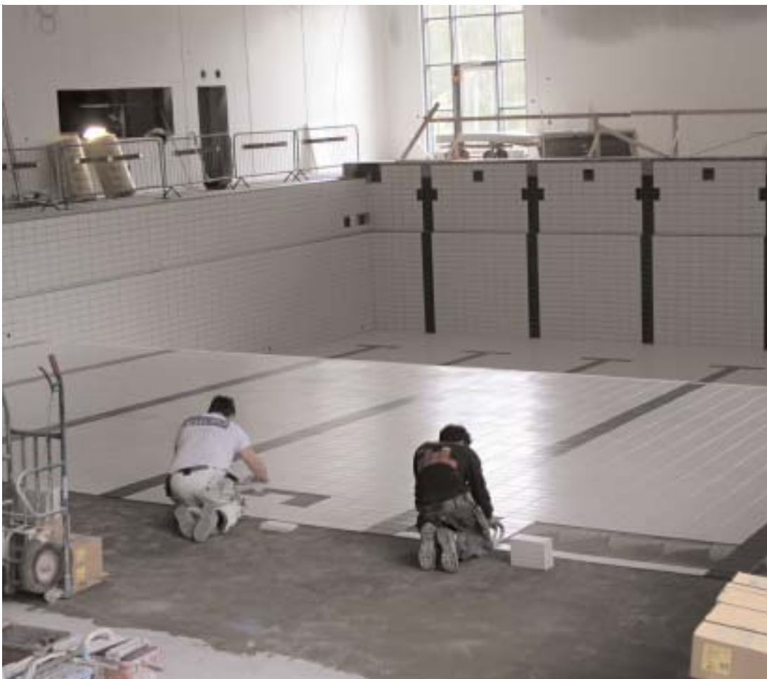
Kaklandet av den stora bassängen börjar närma sig slutet. Det är ett jättelikt pussel, som de tre kakelsättarna har haft framför sig. Det gäller att få banlinjerna på rätt plats. Inte det enklaste i synnerhet när man tvingats arbeta sig baklänges upp ur den djupare delen.

Efter två decennium kan vi äntligen skönja ett slut på den segdragna historien om varmvattenbassängen i Alvesta. Att det har varit segdraget tidigare är välkänt, men själva byggnationen har varit rena motsatsen.