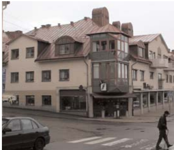
Äldreboendet Bryggaren är tänkt att avvecklas när ett nytt boende står färdigt. Men med en ökad äldre befolkning kan Bryggaren också behövas.

Frågan är om andra partier är beredda att göra detsamma.